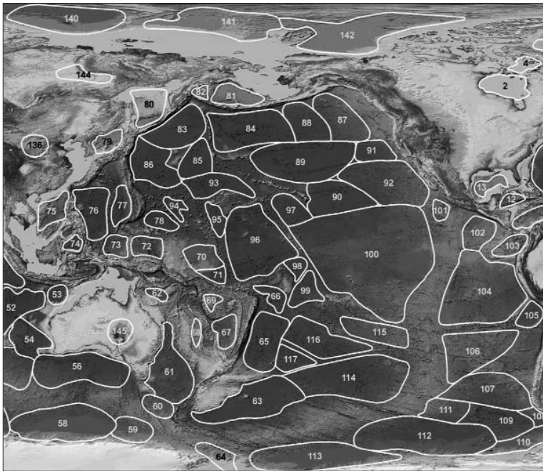
Рис. 3. Тихий океан