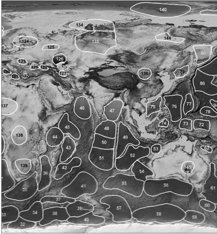
Рис. 2. Індійський океан